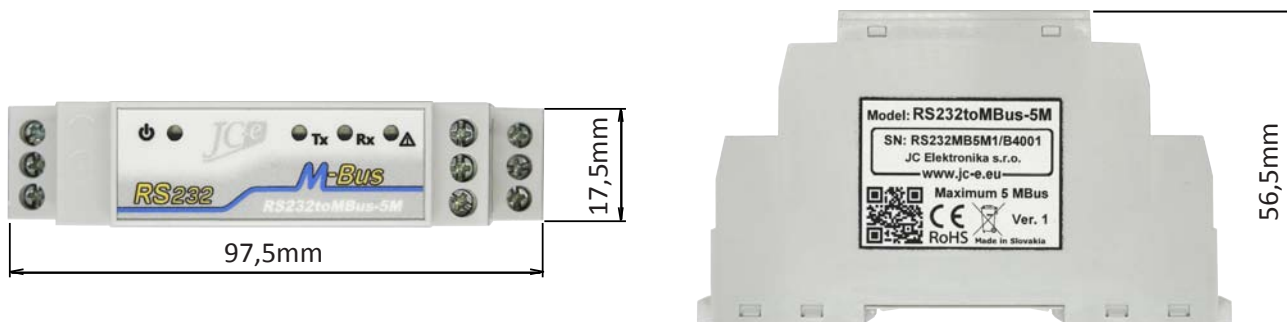
Pohľad z vrchu

Prevodník je umiestnený v štandardnej plastovej krabičke určenej pre montáž na 35mm lištu. Prevodník má veľmi malú šírku len 17,5mm.