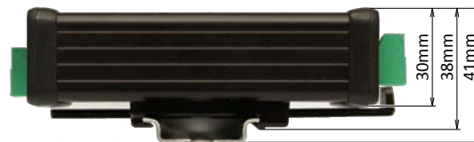
Pohľad z boku s pripevnenou DIN lištou