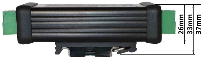
Pohľad z boku s pripevnenou DIN lištou