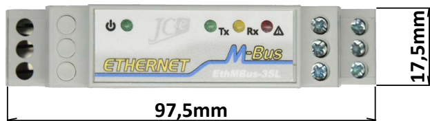
Pohľad z vrchnej strany

Prevodník je umiestnený v štandardnej plastovej krabičke určenej pre montáž na 35mm lištu. Prevodník má veľmi malú šírku len 17,5mm. Hmotnosť prevodníka je 52g.