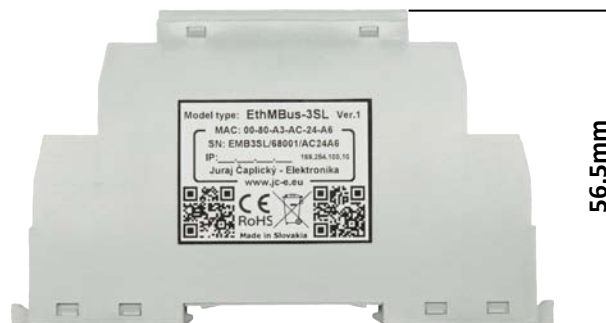
Pohľad z boku