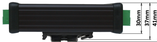
Pohľad z boku s pripevnenou DIN lištou