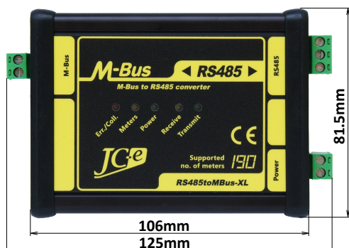
Pohľad z vrchnej strany

Prevodník je vyrobený z robustnej hliníkovej krabičky, ktorá zaisťuje výbornú mechanickú odolnosť prevodníka, zvýšenú odolnosť voči rušeniu a v neposlednom rade zlepšuje aj odvod tepla z prevodníka do priestoru. Prevodník je určený pre montáž na štandardnú 35mm DIN lištu. Hmotnosť prevodníkov je od 230g do 250g.